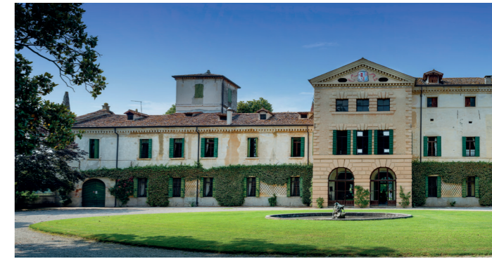
Villa «La Bolzonella»