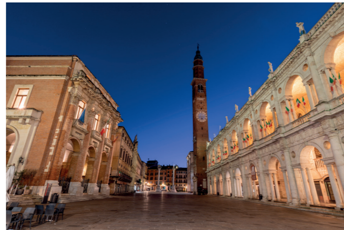
Links Loggia del Capitano, rechts Basilica Palladiana