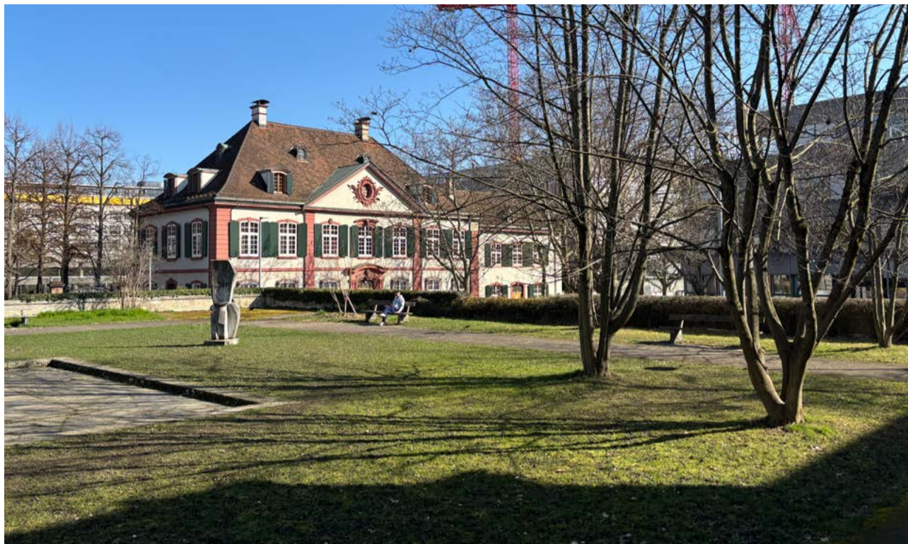
Auf der Hebelschanze, Blick Richtung Holsteinerhof

Durch die die geplante Überbauung dieser Anlage gehen ca. 2000 m 2 Stadtgrün verloren. Daher haben Umweltverbände und der Basler Heimatschutz bereits im Jahr 2020 Einwän-