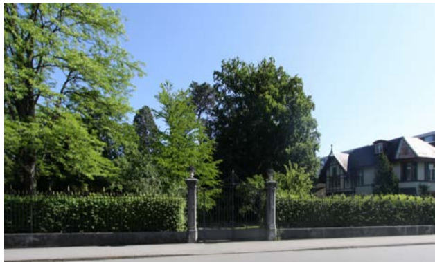
Ansicht von der Gellerstrasse, links Remisen- und Gärtnerhaus von 1900

An der Gellerstrasse 19 hat sich ein eindrucksvoller Villengarten aus dem 19. Jahrhundert grösstenteils erhalten. Er fällt heute vor allem durch seinen wundervollen Baumbestand und die äusserst gepflegte Anlage auf. Sein Kennzeichen ist ein grosser Mammutbaum, eines der seltenen Exemplare dieser Art in Basel.