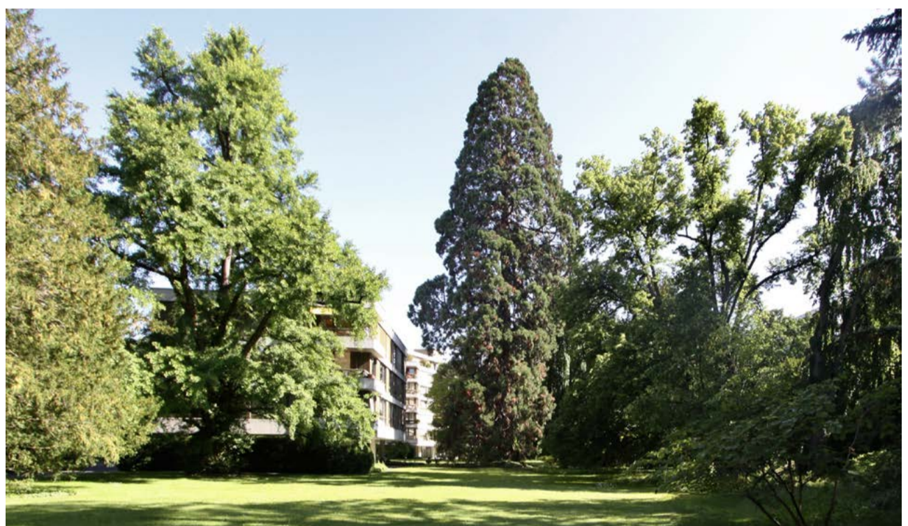
oben: Landschaftspark mit der Villa von 1850, Foto Ludwig Bernauer vor 1974 unten zum Vergleich: heutiger Zustand mit der Wohnbebauung von 1975