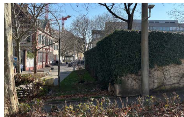
Ecke der Bastion, Richtung Hebelstrasse