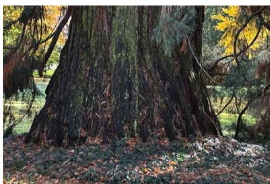
Sequoia Gigantea im Hirzbodenpark