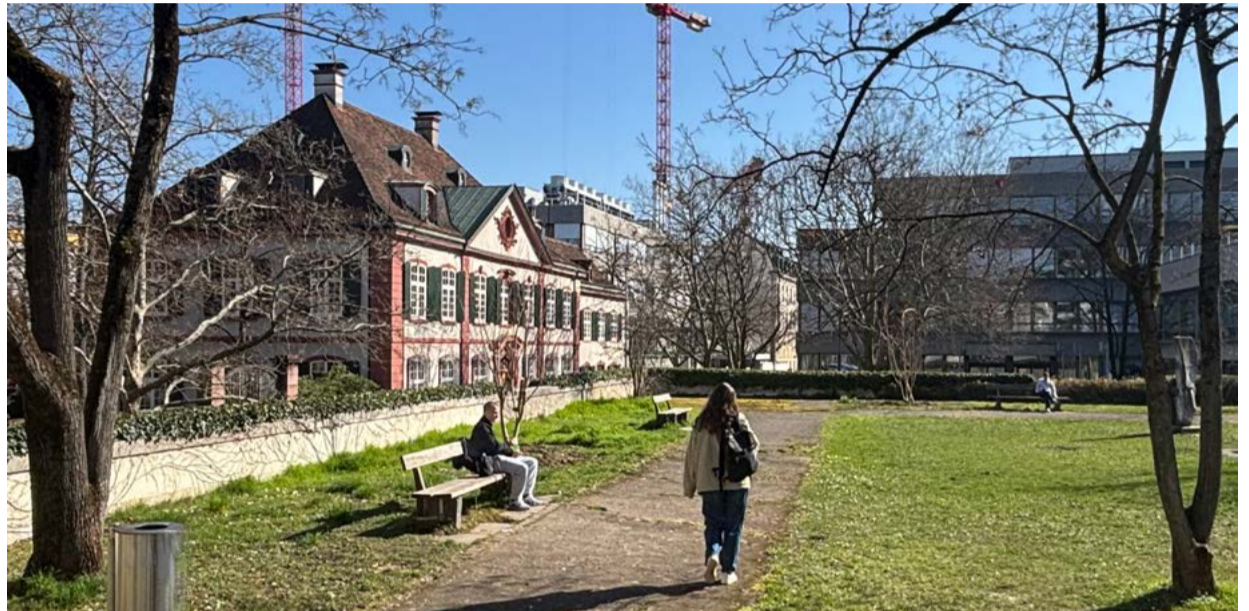
Hebelschanze neben dem Holsteinerhof, Erholungsgebiet in der Altstadt