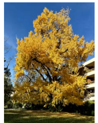
Grosser Ginkgo, der "heilige Baum" Goethes

Weymouth-Kiefern, mächtige Ginkgos und mittlerweile auch viele Eiben von imposanter Höhe. Ganz am Ende der Anlage sind übrigens heute noch spärliche Reste einer ehemaligen Grottenanlage zu sehen.