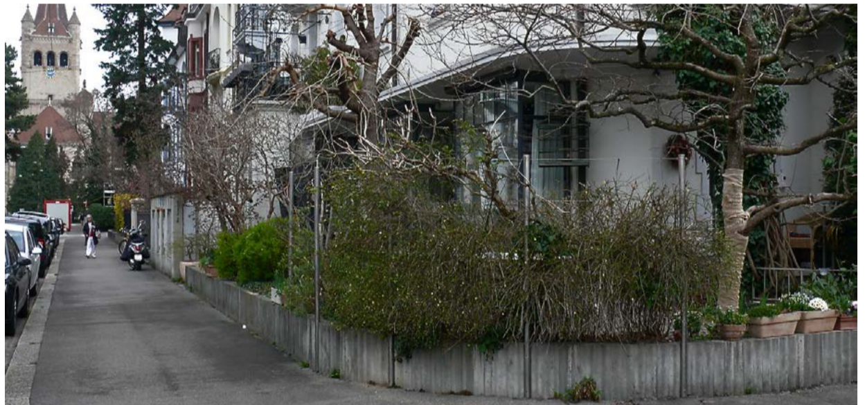
Vorgärten im Paulusquartier, verschieden genutzt