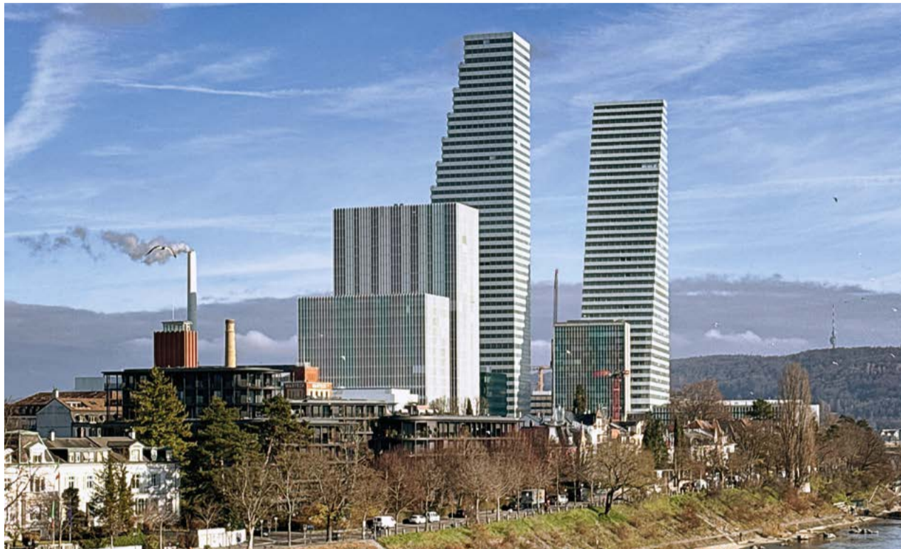
Blick auf die Roche-Türme von der Wettsteinbrücke