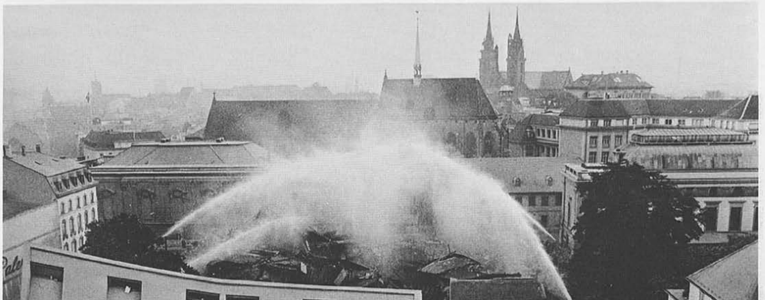
Sprengung des alten Stadttheaters am 6. August 1975

Der Konflikt um die Autogarage anstelle von progressiven Kulturinitiativen markiert einen Scheidepunkt in der Basler Stadtentwicklung. Die Sprengung scheint zwar die vollendete Machtmanifestation der sozialdemokratisch orchestrierten Stadtzerstörung zu sein. Max Wullschlegers (1910 – 2004) Brüskierung der Stadtgesellschaft hat aber das Ende der Altstadtzerstörung herbeigeführt. Die klammheimliche Vernichtungssorgie am 9.