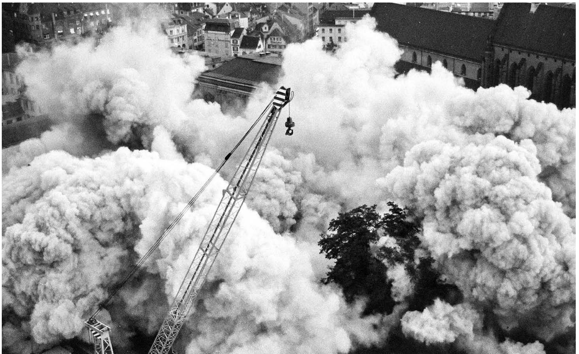
Sprengung des alten Stadttheaters am 6. August 1975

Der Altbau sollte dem Neubau weichen, um Publikumserfolg durch eine bequem gelegene Autogarage herbeizuführen. Die Theater-Tiefgarage ist im System «City-Ring» der Schlussstein der sozialdemokratischen Moderne in Basel. Die beiden Theater-Baukörper hätten ja ohne Einschränkungen nebeneinander bestehen bleiben können. Und das denkmalwürdige Steinenberg-Ensemble zu erhalten, wäre problemlos möglich gewesen. Auf dem Garagedach den öffentlichen Treppenstufen-Platz zu errichten, überzeugt in unmittelbarer Nähe zum Barfüsserplatz bis heute nicht.