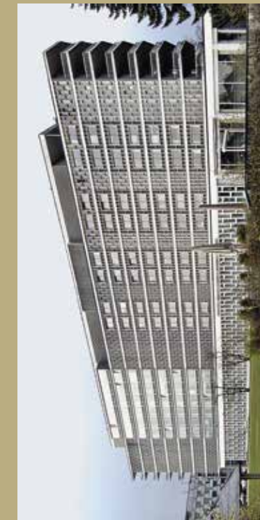
Felix Platter-Spital unter Denkmalschutz

Dank dem Einsatz des Heimatschutz Basel stellte die Basler Regierung den Spitalhauptbau (1961–1967) unter Denkmalschutz. Geschützt werden die Substanz, bzw. die visuelle Erscheinung der variationsreichen Fassade mit ihrer eindrücklichen skulpturalen Qualität.